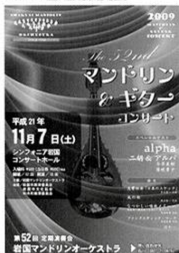
第52回定期演奏会のポスター